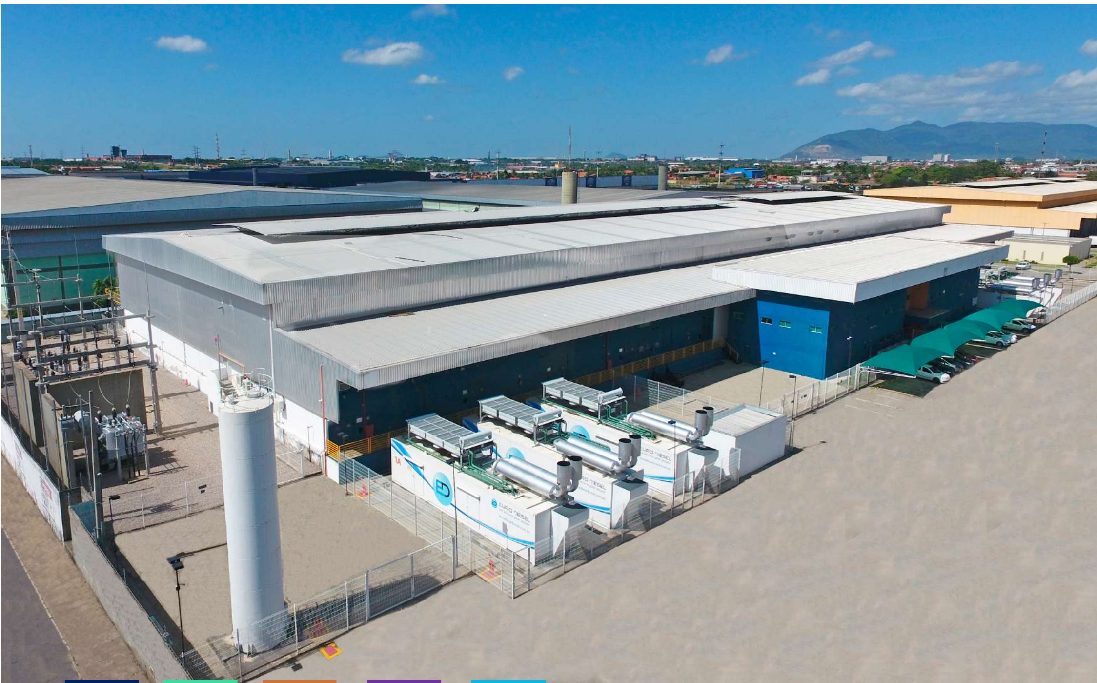
Data Center Fortaleza