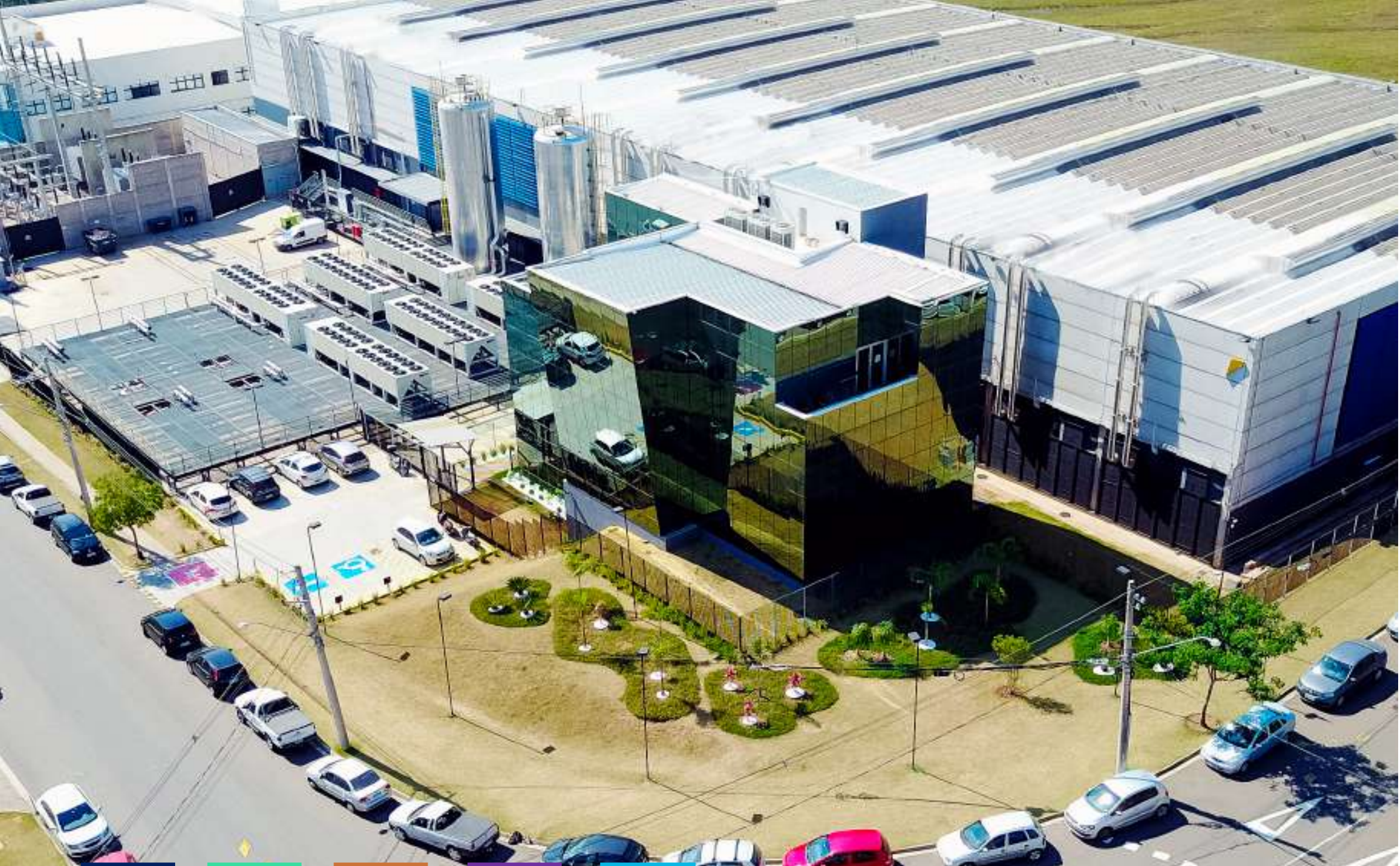
Data Center Jundiaí 1