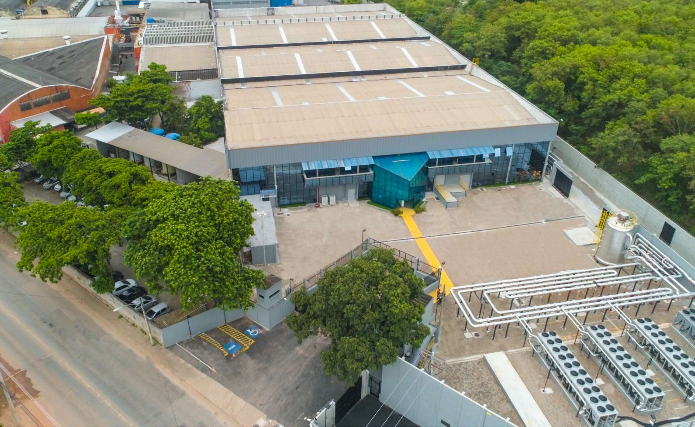
Data Center Rio de Janeiro 1