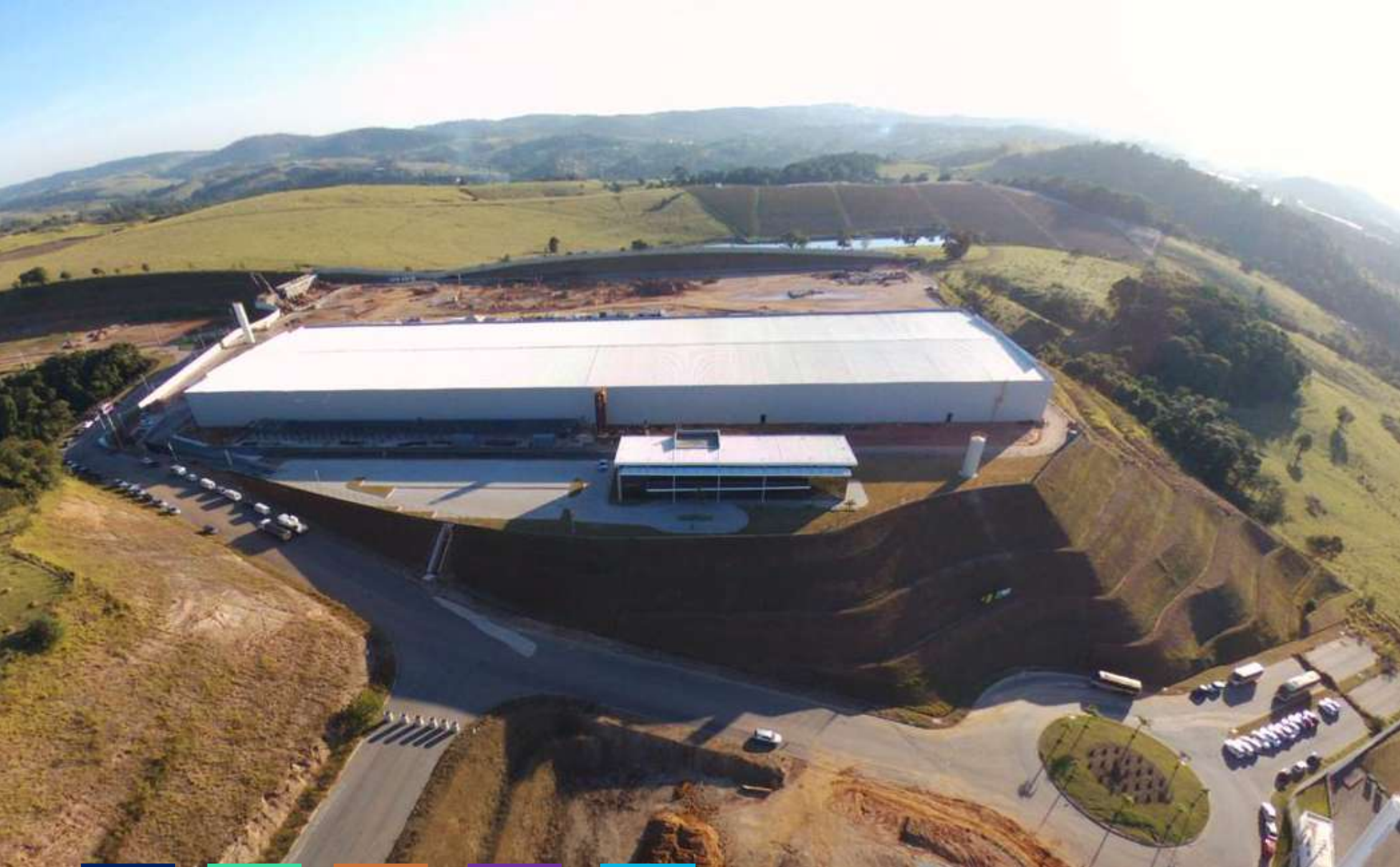
Data Center Vinhedo 2